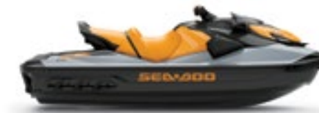
GTI™ SE 170

La garantía limitada de BRP cubre la moto acuática por un año.